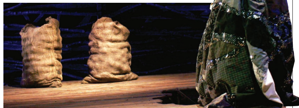
Foto di scena di Lella Costa in Amleto. Al Teatro Carcano fino al 10 febbraio